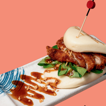
BAO DI POLLO 5

-MAIALE -GAMBERI -POLLO -POLLO E CURRY -MANZO -ANATRA -VEGETARIANI