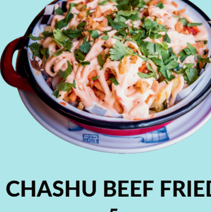
CHASHU BEEF FRIED 5

Crispy chicken wings, marinated with 5 spices, ginger, soy, with sour-spicy sauce