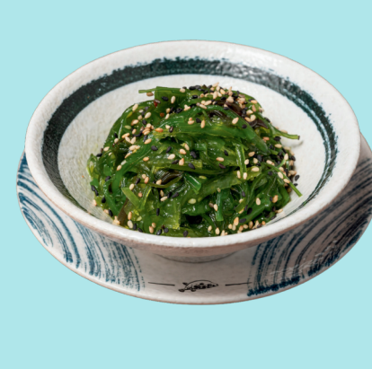
GOMMA WAKAME 3.8