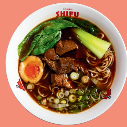
SHICHU RAMEN 14

Original home broth with shoyu sauce base, noodles, soft-boiled egg, spring onion, soybean sprouts, served with tempura shrimp