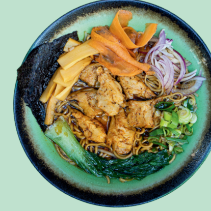
YASAI SHOYU RAMEN 13

Vegan ramen with noodles, vegan protein, miso broth, hell sauce, soybean sprouts, mushrooms, pakchoi, songino, spring onion (very spicy)