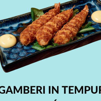
GAMBERI IN TEMPURA 6

Delicious chicken skewers topped with Teriyaki sauce