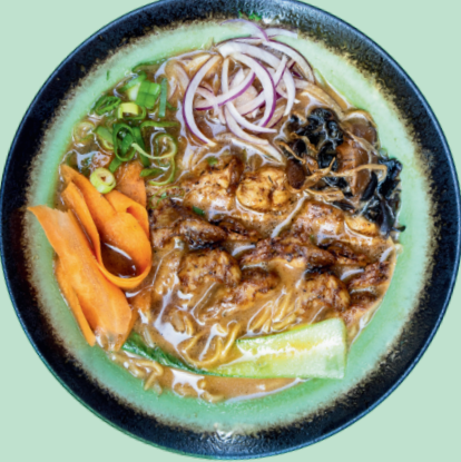
MISO PINNATSU RAMEN 13

Ramen vegano a base di miso e salsa di arachidi, noodles, germogli di soia, carote, proteina vegana, cipolla, funghi, pakchoi, cipollotto