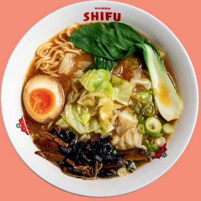
YASAI RAMEN 11

Traditional house broth with fried chicken slices, noodles, pakchoi, naruto, soybean sprouts, bamboo, nori seaweed, soft boiled egg, mushrooms, spring onion