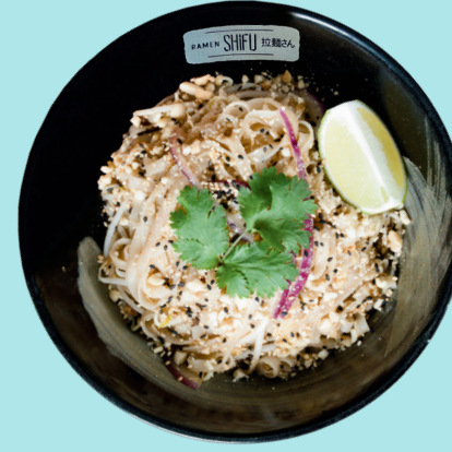
PAD THAI 10.5

Noodles, ground pork, soybean sprouts, peanuts, fried onion, celery, spring onion, encurtido, cilantro