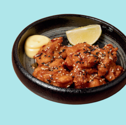
POLLO KARAGE 6

Pollo fritto servito con salsa tonkatsu e mayo giapponese