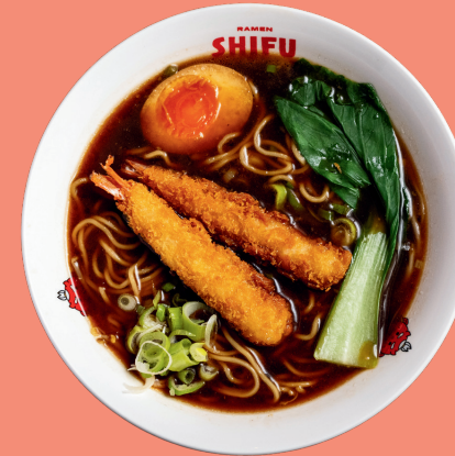
EBI TEMPURA RAMEN 14

Original home broth, noodles, pakchoi, marinated pork, nori seaweed, bamboo, naruto, soft boiled eggs, spring onion, soybean sprouts