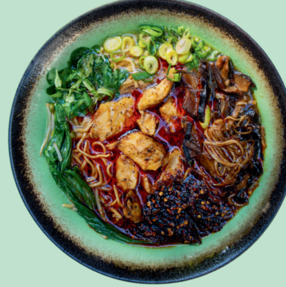
DRAGON RAMEN 13

Vegan Ramen made with curry sauce, noodles, vegan protein, pakchoi, mushrooms, songino, spring onion, soybean sprouts