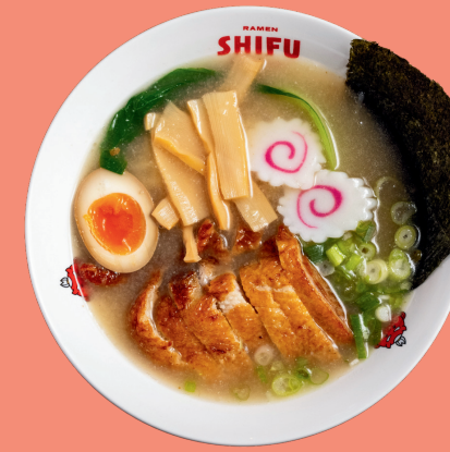
RAMEN DI ANATRA 14.5

Vegetarian ramen with noodles, soybean sprouts, pakchoi, nori seaweed, bamboo, spring onion, cabbage, and mushrooms, served with miso broth