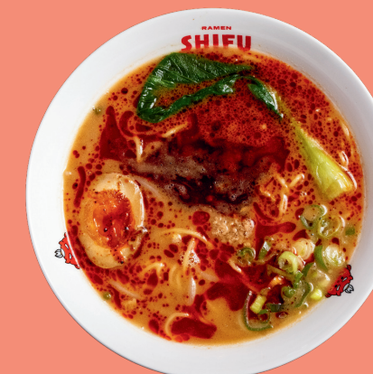
TAN TAN RAMEN 13.5

Brodo della casa con aggiunta di salsa piccante Tan Tan, noodles, pakchoi, carne trita speziata, uovo alla coque, cipollotto, germogli di soia, salsa di arachidi