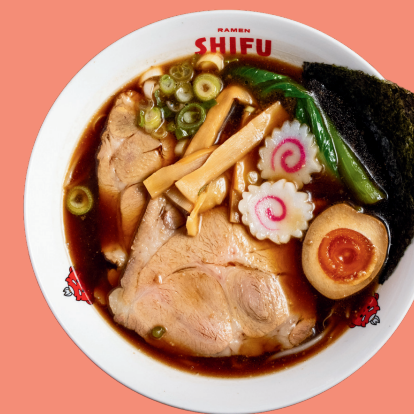
SHOYU RAMEN 12

Original home broth, pakchoi noodles, marinated pork, nori seaweed, bamboo, naruto, soft boiled eggs, spring onion, soybean sprouts