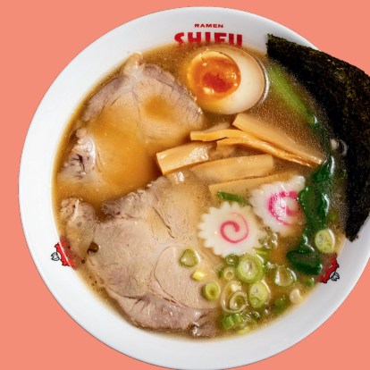
MISO RAMEN 12

Original home broth with shoyu sauce base, noodles, pakchoi, marinated pork, nori seaweed, bamboo, naruto, soft boiled eggs, spring onion, soybean sprouts