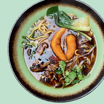
EBI VEGGY RAMEN 14

Vegan soy and vegetable-based Ramen, noodles, vegan protein, soybean sprouts, carrots, onions, bamboo, pakchoi, spring onion, nori seaweed