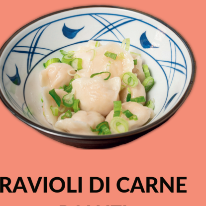
RAVIOLI DI CARNE BOLLITI 9

Ravioli di carne bolliti (10pz.) serviti con brodo alla salsa shoyu, erba cipollina, sedano, alga nori tritata