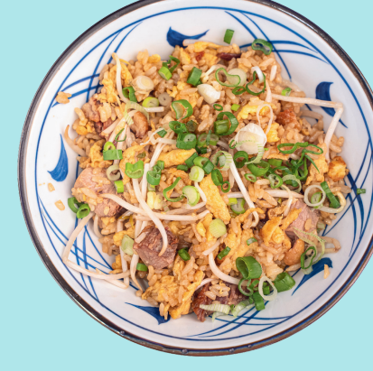
RISO KIKU 10

Stir-fried rice with chashu (spiced pork) spring onion, scrambled eggs