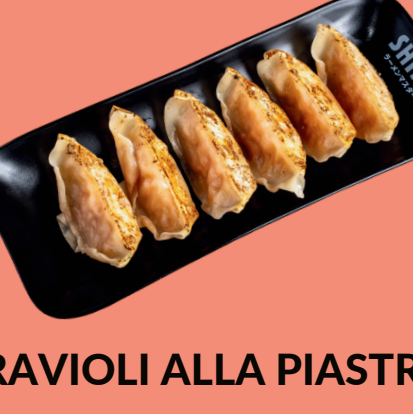
RAVIOLI ALLA PIASTRA 5.5

Boiled meat ravioli (10pcs.) served with broth with shoyu sauce, chives, celery, chopped nori seaweed