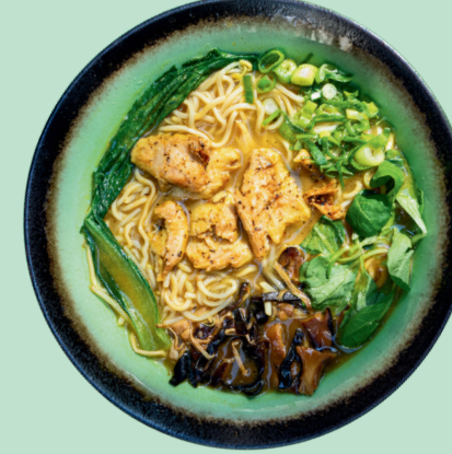
VEGGY CURRY RAMEN 13

Vegan ramen made with miso and peanut sauce, noodles, soybean sprouts, carrots, vegan protein, onion, mushrooms, pakchoi, spring onion