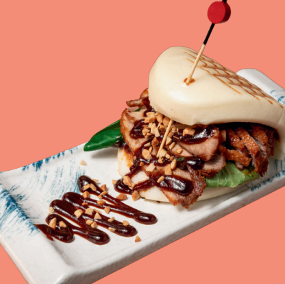
BAO DI ANATRA 5

Grilled bao stuffed with chashu (marinated pork), peanuts, served with spicy mayonnaise