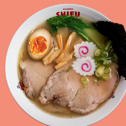
TONKOTSU RAMEN 12

House broth with curry, noodles, soybean sprouts, marinated pork, soft boiled egg, spring onion