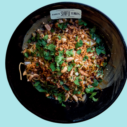
MAZESOBA PINATTU 10.5

Noodles with chashu (spiced pork), eggs, peanuts, fried onion, soybean sprouts, spring onion, encurtido, cilantro, celery