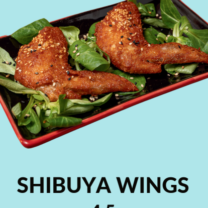
SHIBUYA WINGS 4.5

Meatballs stuffed with potatoes and squid with mayo and Okonomiyaki sauce