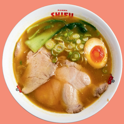
CHASHU CURRY RAMEN 13.5

Brodo della casa con curry, noodles, germogli di soia, carne di maiale marinata, uovo alla coque, cipollotto