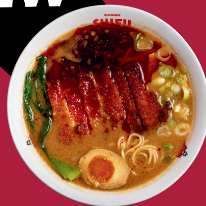
TAN TAN CHICKEN RAMEN 14

Brodo di miso, salsa di arachidi, croccante pollo fritto, salsa Tan Tan, cipollotto, germogli di soia, bambù, alga nori, uovo alla coque e pakchoi