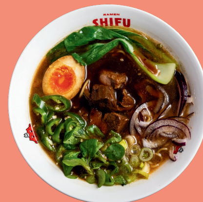
BEEF RAMEN 13

Home broth with miso sauce, pakchoi, noodles, soft boiled eggs, spring onion, chashu meat (spicy pork) special hot sauce