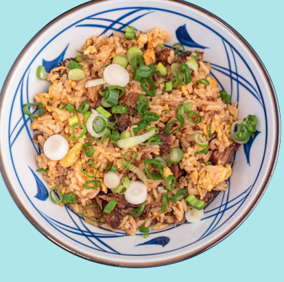
RISO SAKURA 9

Riso saltato con chashu (carne di maiale speziata), cipollotto, uova strapazzate