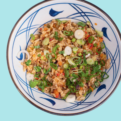
RISO VERDURE AL CURRY 9

Rice with chicken, scrambled eggs, spring onion, red onion, chopped nori seaweed