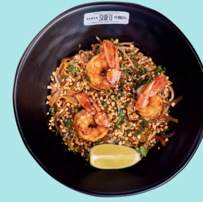
PAD THAI CON GAMBERI 11.5

Noodles stir-fried with cabbage, red peppers, soybean sprouts, black and white sesame, pakchoi, spring onion, soy sauce