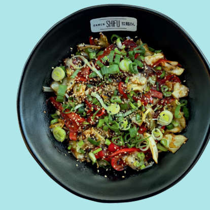
YAKISOBA VEGETALE 9.5

Rice noodles with peanuts, egg, black and white sesame, soybean sprouts, cilantro, red onion, lime