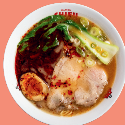
INFERNO RAMEN 14

Traditional house broth with spicy marinated cabbage, noodles, soybean sprouts, chashu pork belly, pakchoi, kimchi, soft boiled egg, spring onion