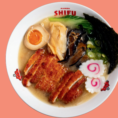
FRIED CHICKEN RAMEN 13.5

Original home broth with miso sauce, noodles, pakchoi, marinated pork, nori seaweed, bamboo, naruto, soft boiled eggs, spring onion, soybean sprouts