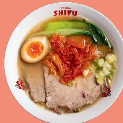
KIMCHI RAMEN 14

Home broth with added spicy Tan Tan sauce, noodles, pakchoi, spicy minced meat, soft boiled egg, spring onion, soybean sprouts, peanut sauce